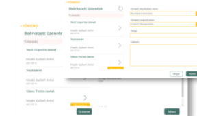
Munkatársak közötti üzenetküldés