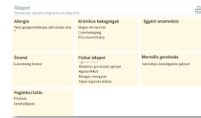
Automata feladatkiosztás a lakók állapota alapján